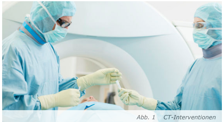
Abb. 1 CT-Interventionen

Beispiele hierfür zeigen die Abbildungen 1 und 2.