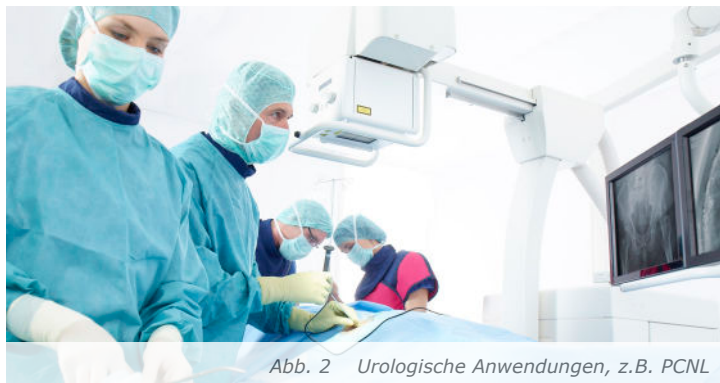
Abb. 2 Urologische Anwendungen, z.B. PCNL